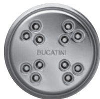
BUCATINI-EINSATZ dicke, Spaghetti-ähnliche Röhren-Nudel, 25 bis 30 cm Länge und 3 mm Durchmesser