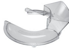
5KN1PS EINTEILIGER SPRITZSCHUTZ MIT EINFÜLLSCHÜTTE

Drei Zusatztrommeln für den MVSA! Komplett mit Kronreibe für Kartoffeln, Julienne raspel und feiner Raspeltrommel.