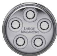
PENNE-EINSATZ/GROBE MAKKARONI röhrenförmige Nudeln mit Rillen