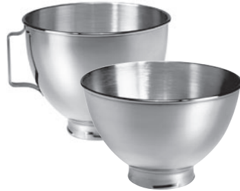
5K45SBWH 4.28 L 5KB3SS 3 L ZUSATZSCHÜSSELN

Zermahlt Weizen, Hafer, Reis, Mais, Gerste, Buchweizen, Hirse und andere nicht öhlende Getreide mit niedrigem Feuchtigkeitsgehalt. Der Mahlgrad kann von feinem Mehl bis hin zu grobkörnigem Getreide gewählt werden. Ganzmetall.