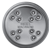
KLEINER MAKKARONI- EINSATZ kurze, dünne, röhrenförmige Nudeln mit Rillen