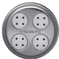
SPAGHETTI-EINSATZ lange, dünne und runde Nudeln

Dieser Röhrennudelvorsatz ist ideal für die einfache Zubereitung von selbstgemachter frischer Pasta. Dieser Vorsatz enthält ein Kombiwerkzeug, einen Aufbewahrungsbehälter, einen Reinigungspinsel und 6 Einsätze. Jeder Einsatz besteht aus einem Metallrahmen und zwei Kunststoffeinsätzen.