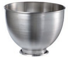
K45SB GRIFFOSE 4,28-L-SCHÜSSEL AUS GEBÜRSTETEM EDELSTAHL