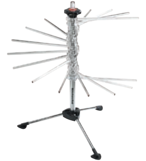
5KPDR PASTATROCKNER (mit schwarzem oder blauem Standfuß)

Die perfekte Ergänzung für den Nuodelvorsatz (KPRA). Zum Füllen Ihrer Lieblingspasta. Hergestellt aus haltbarem, verchromtem Metall.