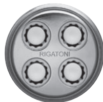
RIGATONI-EINSATZ besonders kurze, röhrenfö- rmige Nudeln mit Rillen und gerade geschnittenen Enden