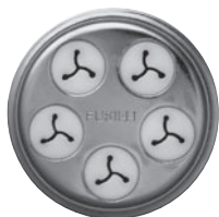
FUSILLI-EINSATZ spiralförmige Nudeln, ca. 4 cm Länge